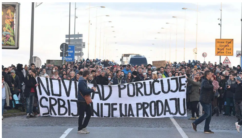
Slika 4. Danas , 1. 12. 2021.