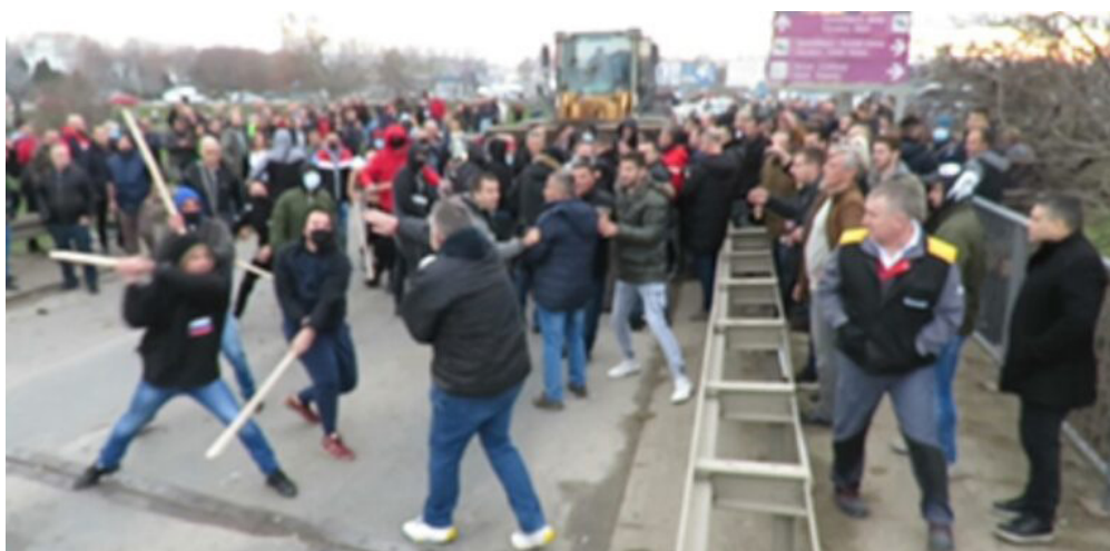
Slika 2. Danas , 27. 11. 2021.