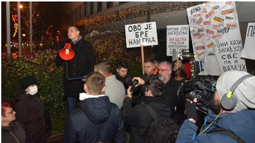
Slika 5. Danas , 3. 12. 2021.